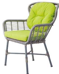
張地: サンプルラ・5429-0000(GA) ¥84,000

サンプルラはP273からお選びください。 ＊背と座の2色張りにつきましては、 別途お見積もりとさせていただきます。