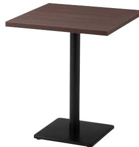
CT-193 + BS-1A(ブラック) W600×D600×H7229mm迄 ￥34,400