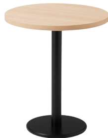
CT-192 + BR-1A(ブラック) 600φ×H729mm迄 ￥45,600