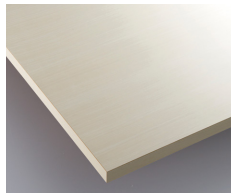
ホワイトウォッシュ (メラミン化粧板:VBX-5769U8)