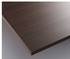
ダークブラウン (メラミン化粧板:VBEX-5772U8)