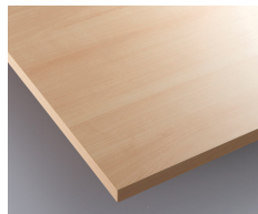
ナチュラル (メラミン化粧板:VBX-5767U8)