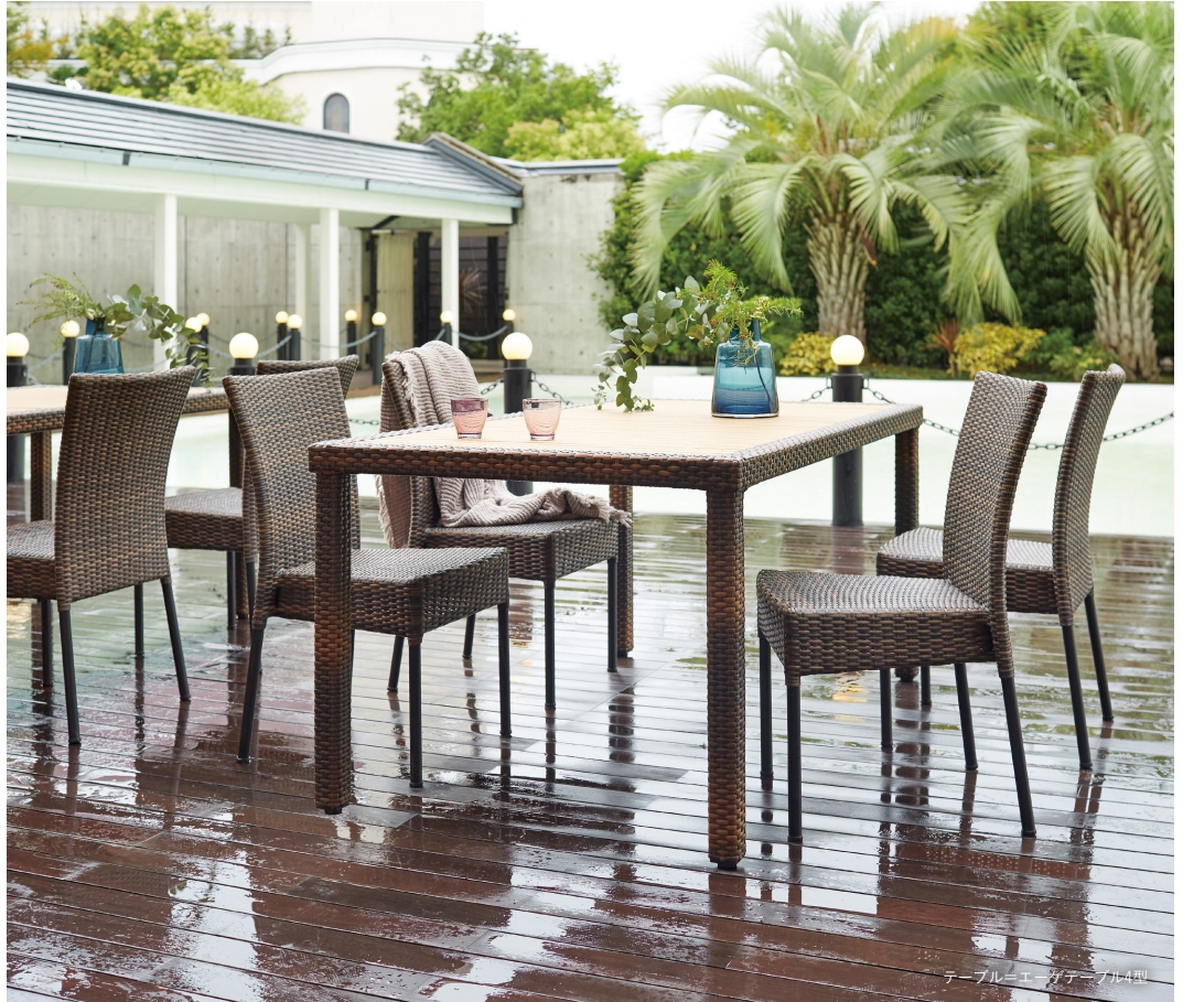
テーブル・エーゲテーブル4型