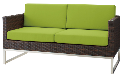
L 張地: サンプルラ・5429-0000 (GA) ¥272,000