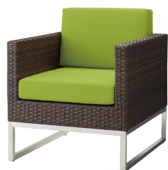
M 張地: サンプルラ・5429-0000 (GA) ¥157,000