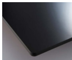
ブラック (メラミン化粧板:K-6400KG)