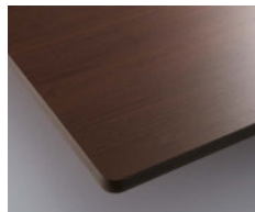
ダークブラウン (メラミン化粧板:TJ-2063K)