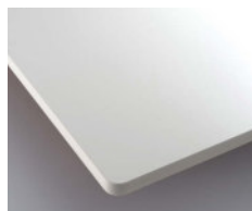
ホワイト (メラミン化粧板:K-6000KG)