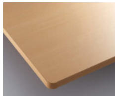
ナチュラル (メラミン化粧板:TJY146K)