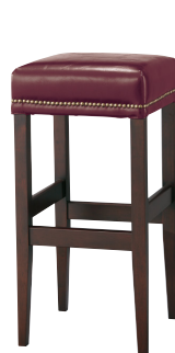
C 張地: レザー・サンセブン・L-8636(A) ¥26,000