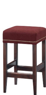
B 張地: 布・カプリス・7(D) ¥26,400