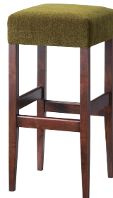
C 2型 張地: 布・モコモコケット・MK-08(D) ¥26,400