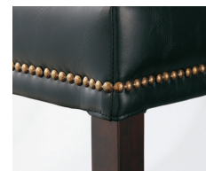
座側面はアンティーク風の紙打ち仕上げになっています。