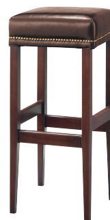
D 張地: レザー・サンセブン・L-8632(A) ¥28,000