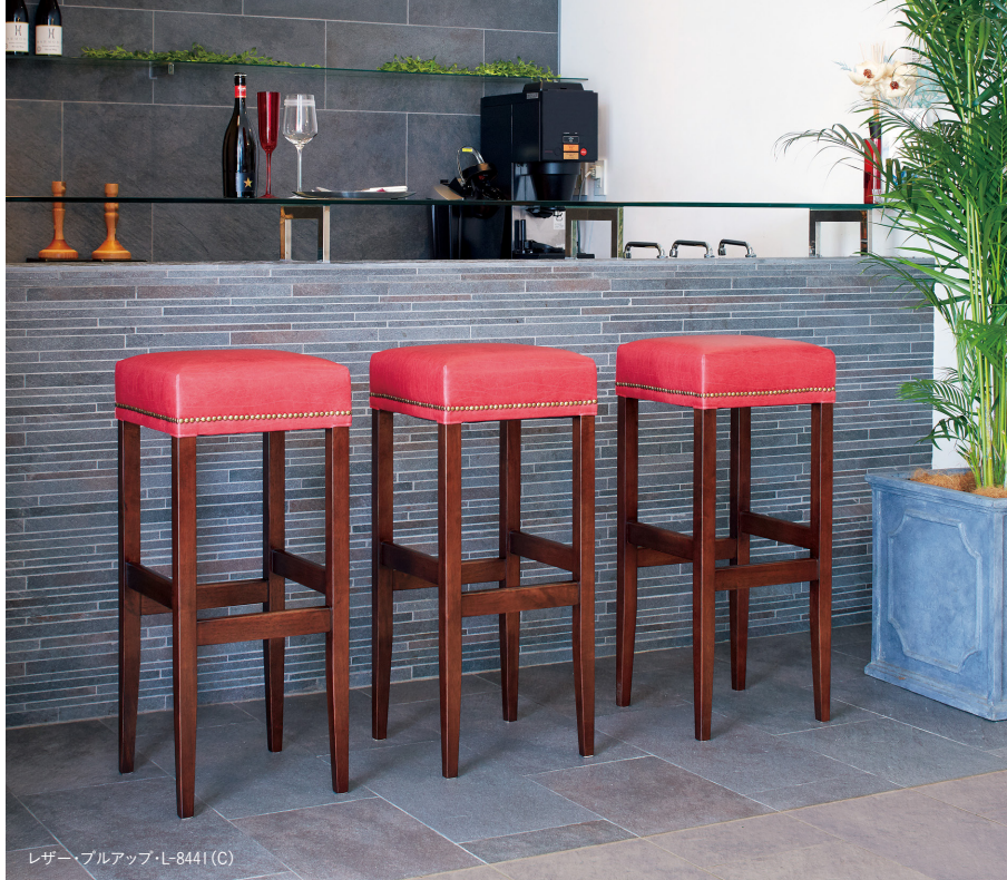
レザー・ブルアップ・L-8441 (C)