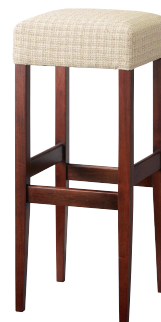
D 2型 張地: 布・オルフェー1(E) ¥29,200