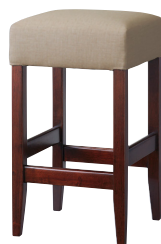
B 2型 張地: レザー・オクタビア・L-8163(B) ¥22,800