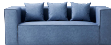
2S 張地:レザー・デニムII・UP5377(B) ¥218,400