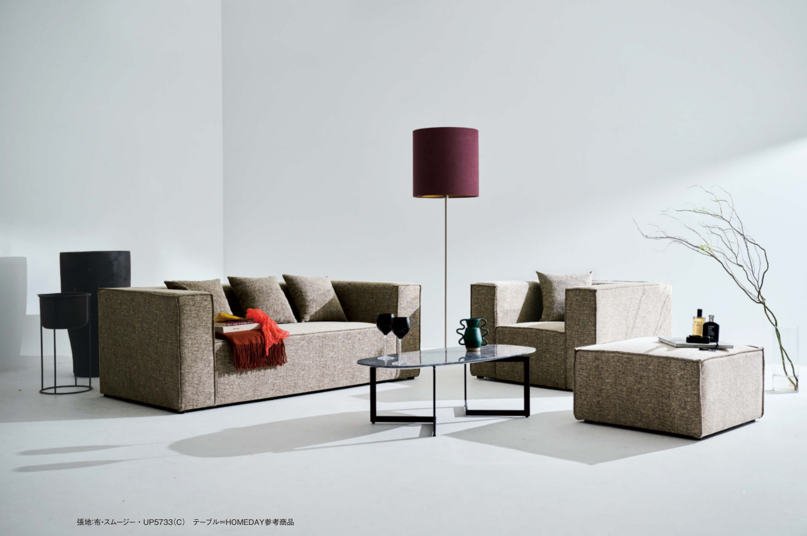
張地:布・スムージー・UP5733(C) テーブル=HOMEDAY参考商品