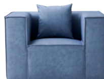
1S 張地:レザー・デニムII・UP5377(B) ¥130,800

*本体とクッションの2色 張りにつきましては、 別途お見積りとさせていただきます。